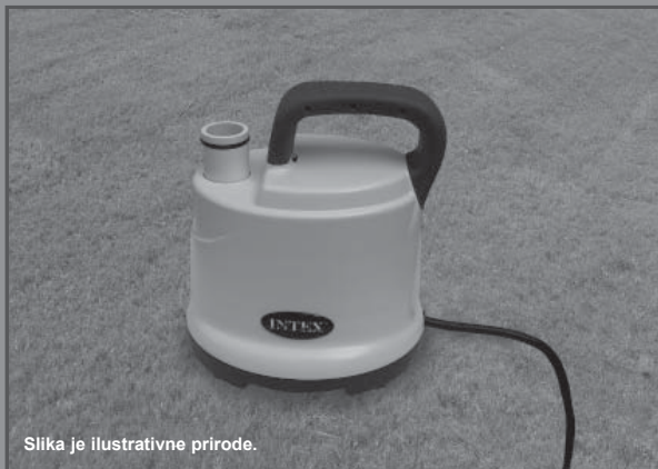
Slika je ilustrativne prirode.

Ne zaboravite da isprobate druge izuzetne proizvode Intexa: bazene, dodatke za bazene, bazene i kućne igračke na naduvavanje, krevete na naduvavanje i čamce. Potražite ih u dobro opremljenim prodavnicama ili posetite našu dole navedenu internet stranicu. Zbog politike stalnog poboljšanja proizvoda, Intex zadržava pravo izmene specifikacija i izgleda usled čega priručnik s uputstvima može biti ažuriran bez obaveštenja.