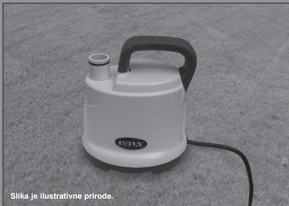
Slika je ilustrativne prirode.

Ne zaboravite da isprobate druge izuzetne proizvode Intexa: bazene, dodatke za bazene, bazene i kućne igračke na naduvavanje, krevete na naduvavanje i čamce. Potražite ih u dobro opremljenim prodavnicama ili posetite našu dole navedenu internet stranicu. Zbog politike stalnog poboljšanja proizvoda, Intex zadržava pravo izmene specifikacija i izgleda usled čega priručnik s uputstvima može biti ažuriran bez obaveštenja.